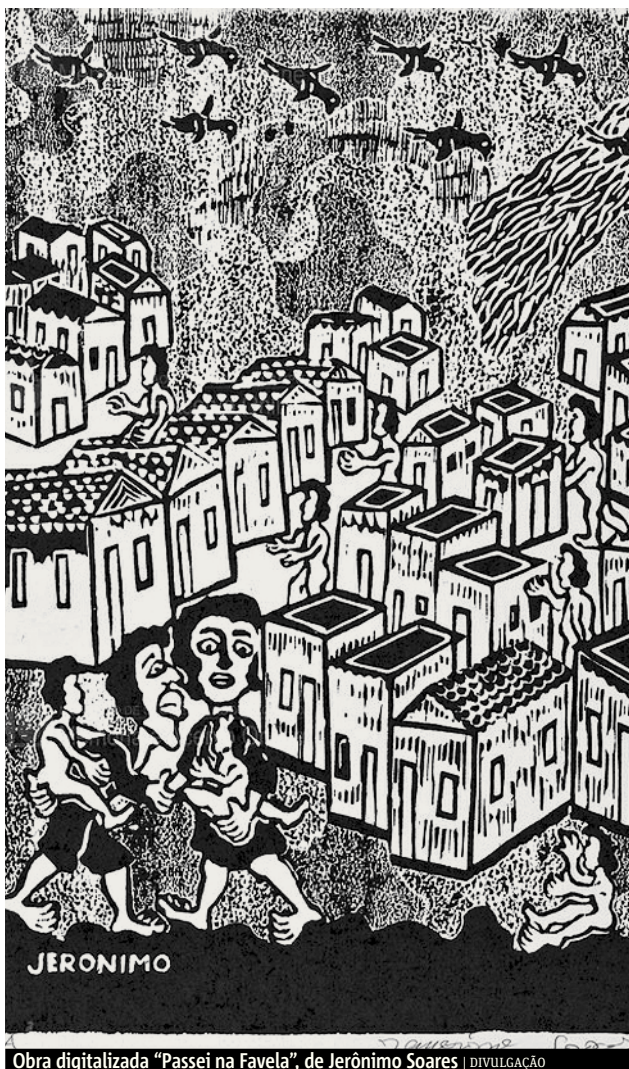
Obra digitalizada "Passei na Favela", de Jerônimo Soares